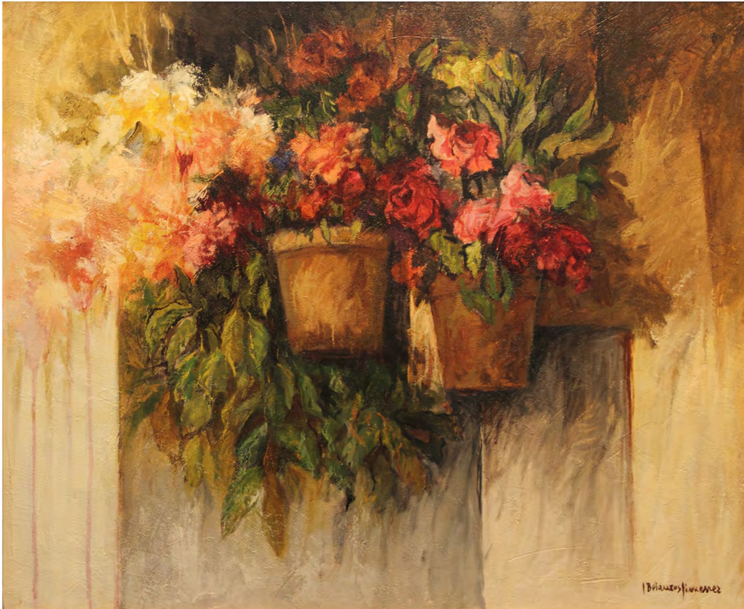
Jardín colgante, Oleo 0,98 x 0,85