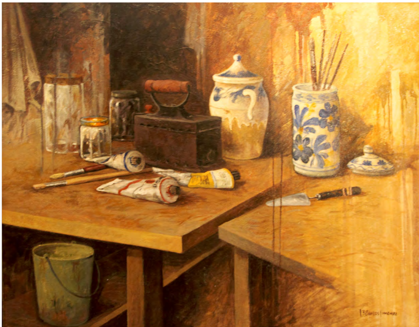
Bodegón de la plancha, Oleo 1,06 x 0,87