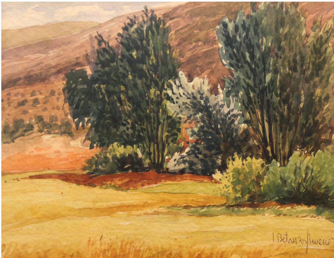
Acuarela 0,48 x 0,36