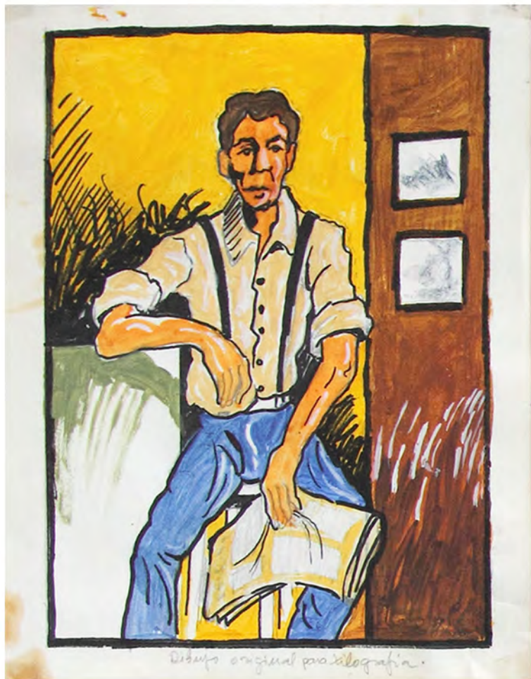
Dibujo original para xilografía