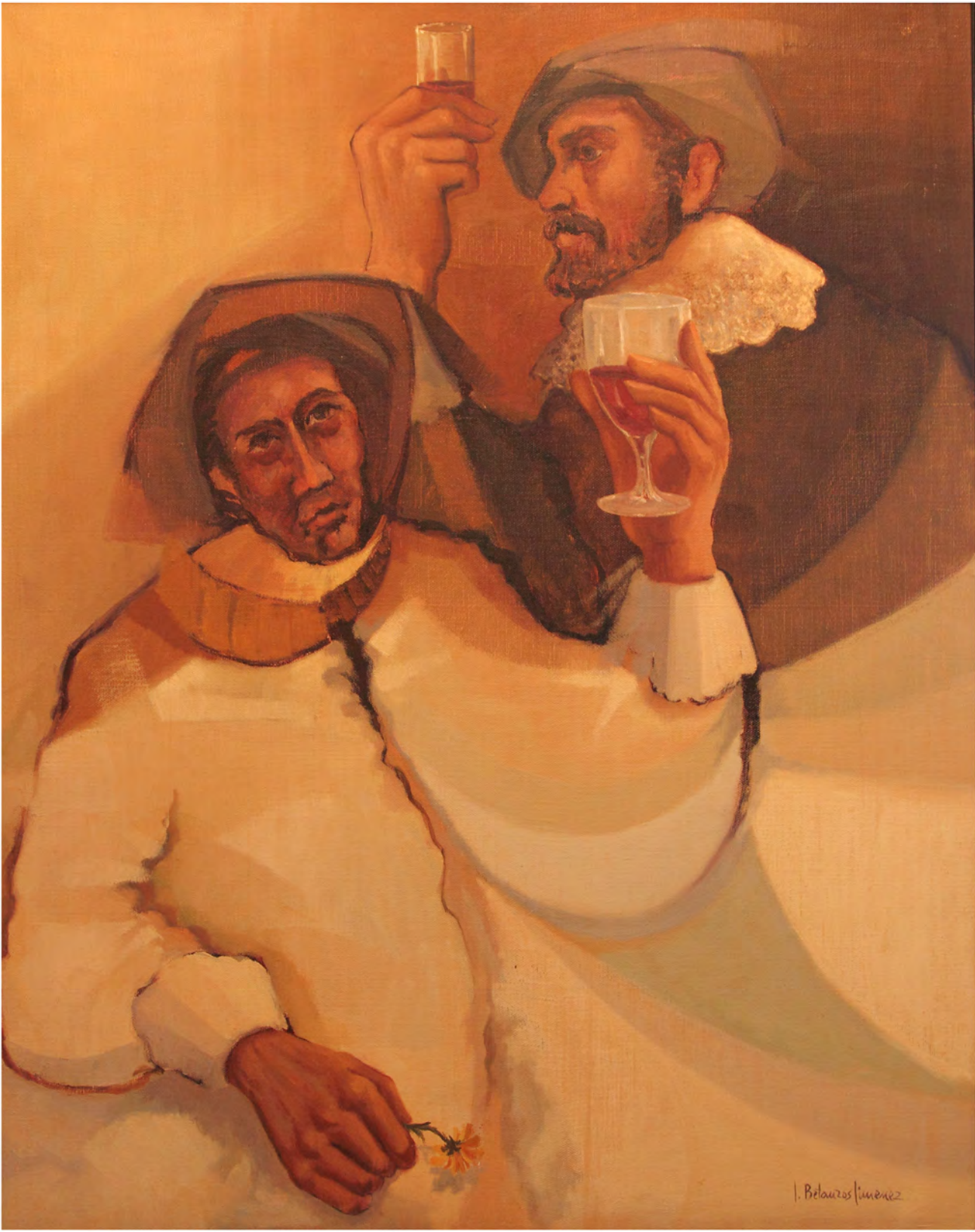
El brindis, Oleo 1,02 x 0,83