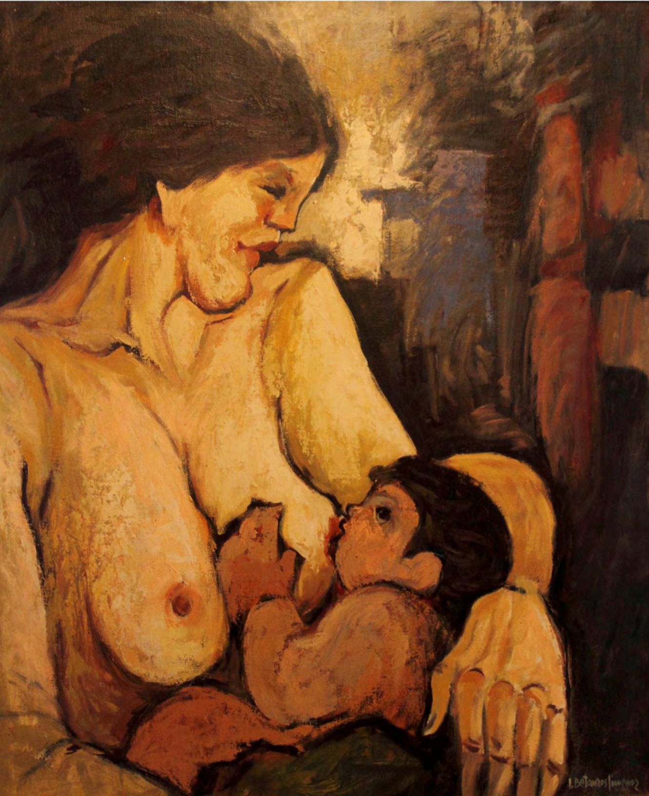
Maternidad, Oleo 0,96 x 0,82