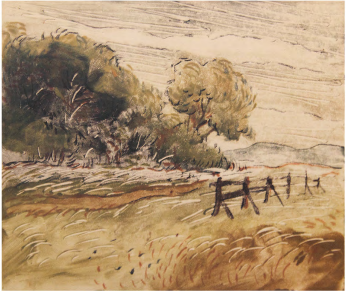
Monotipo, 0,35 x0,28