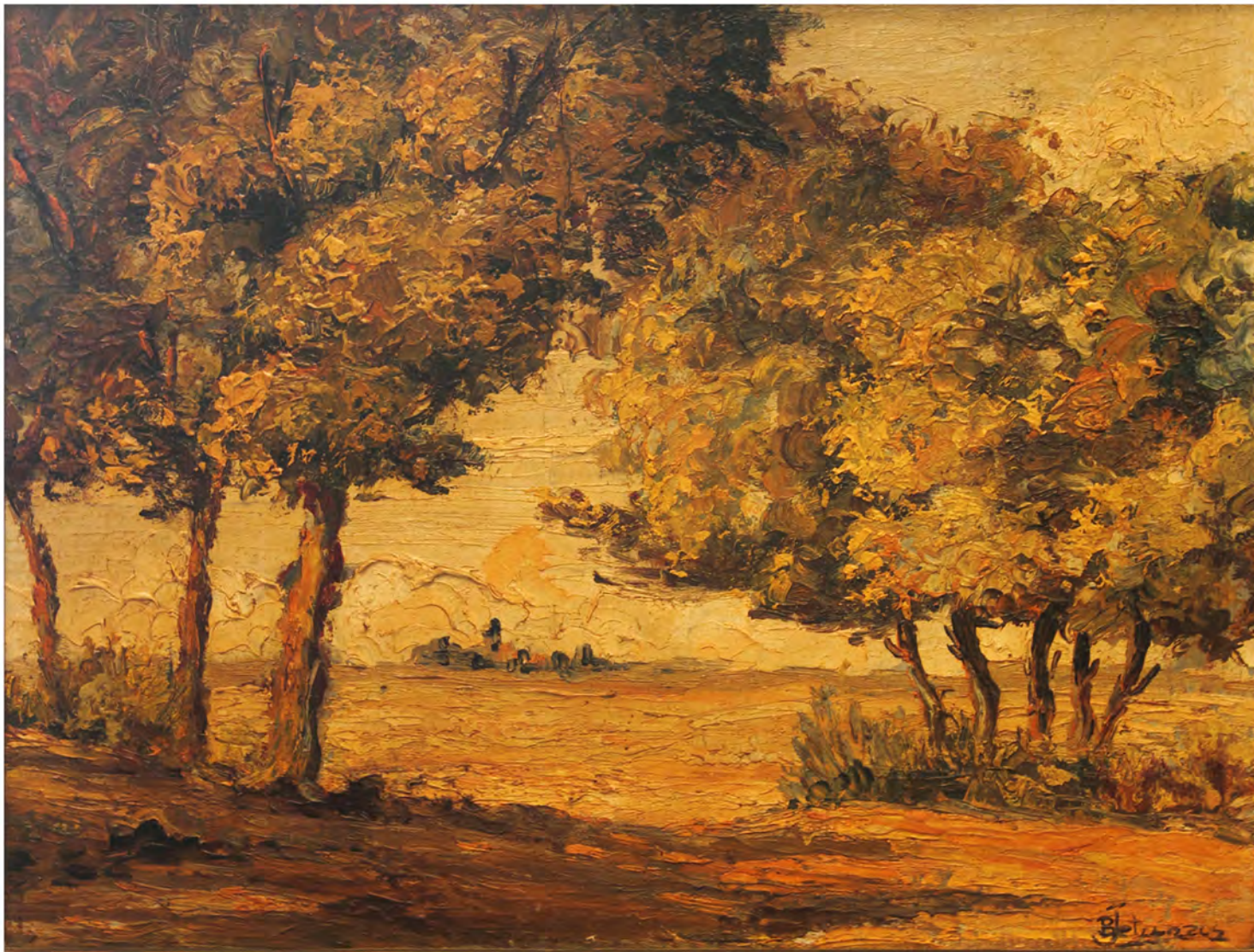
Paisaje de los alrededores de Madrid, Oleo 0,49 x 0,40