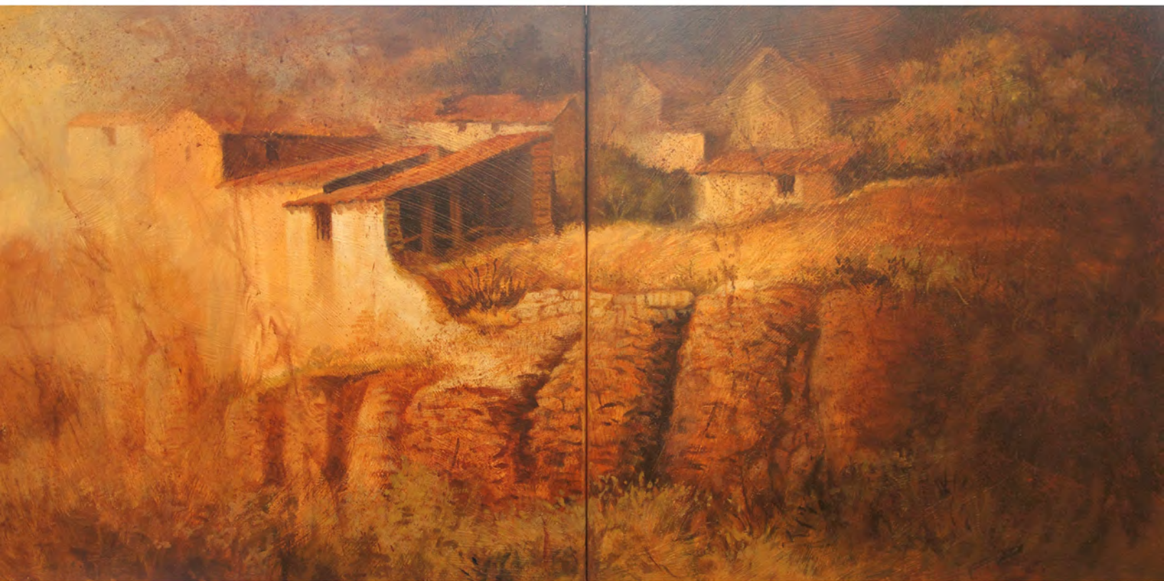
Muralla I, Oleo 1,02 x 0,51