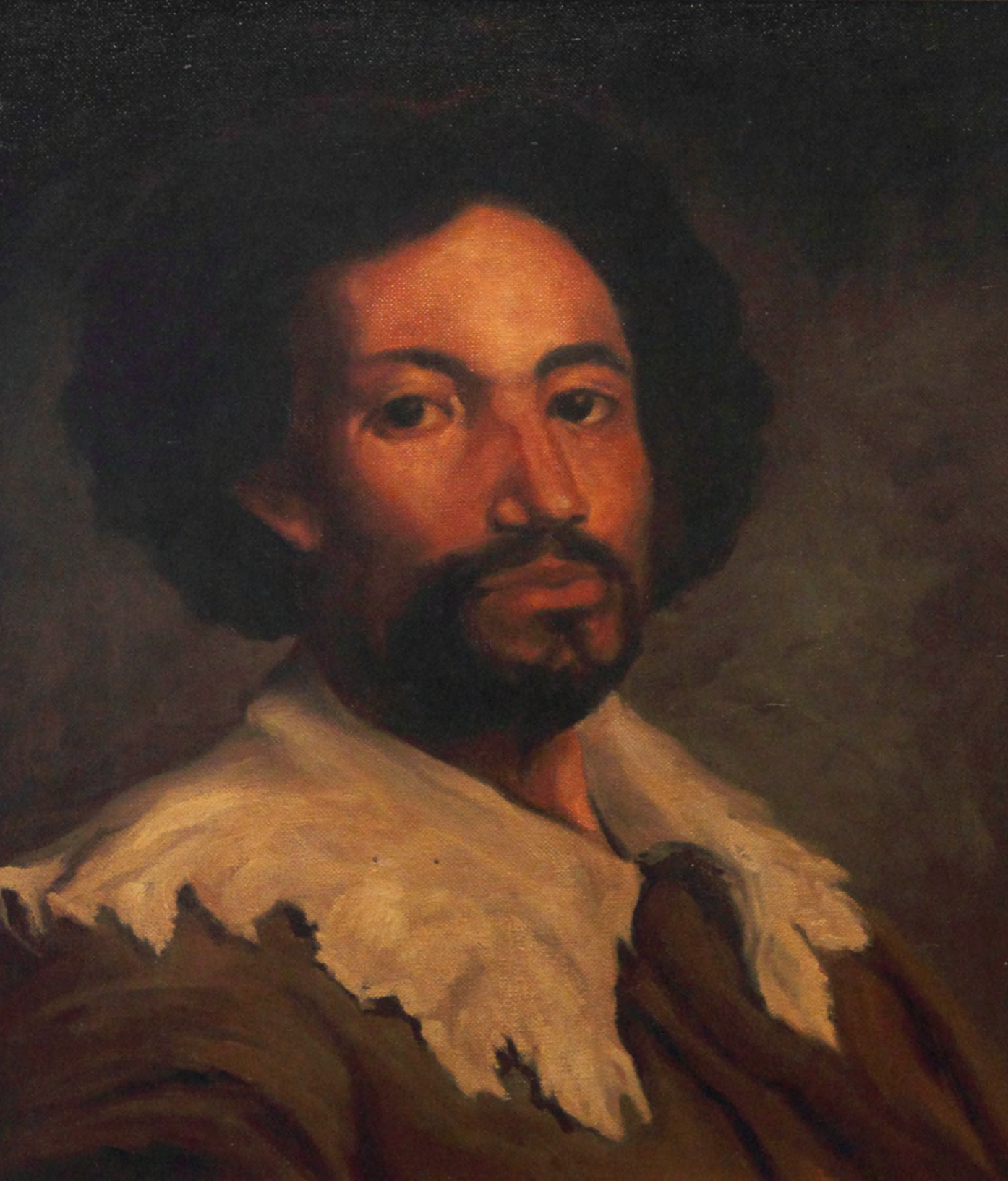
Copia de Velazquez, Oleo 0,41 x 0,33