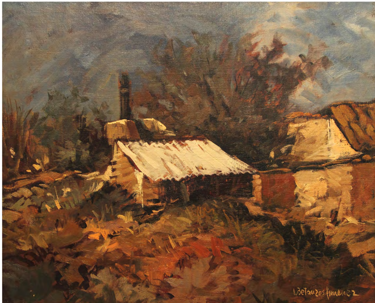
Paisaje Campo de Cartagena, Oleo 0,77 x 0,68