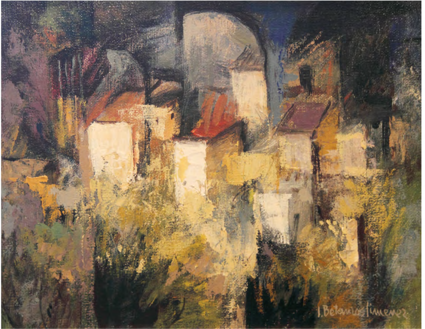
Caserío cubista, Oleo 0,44 x 0,39