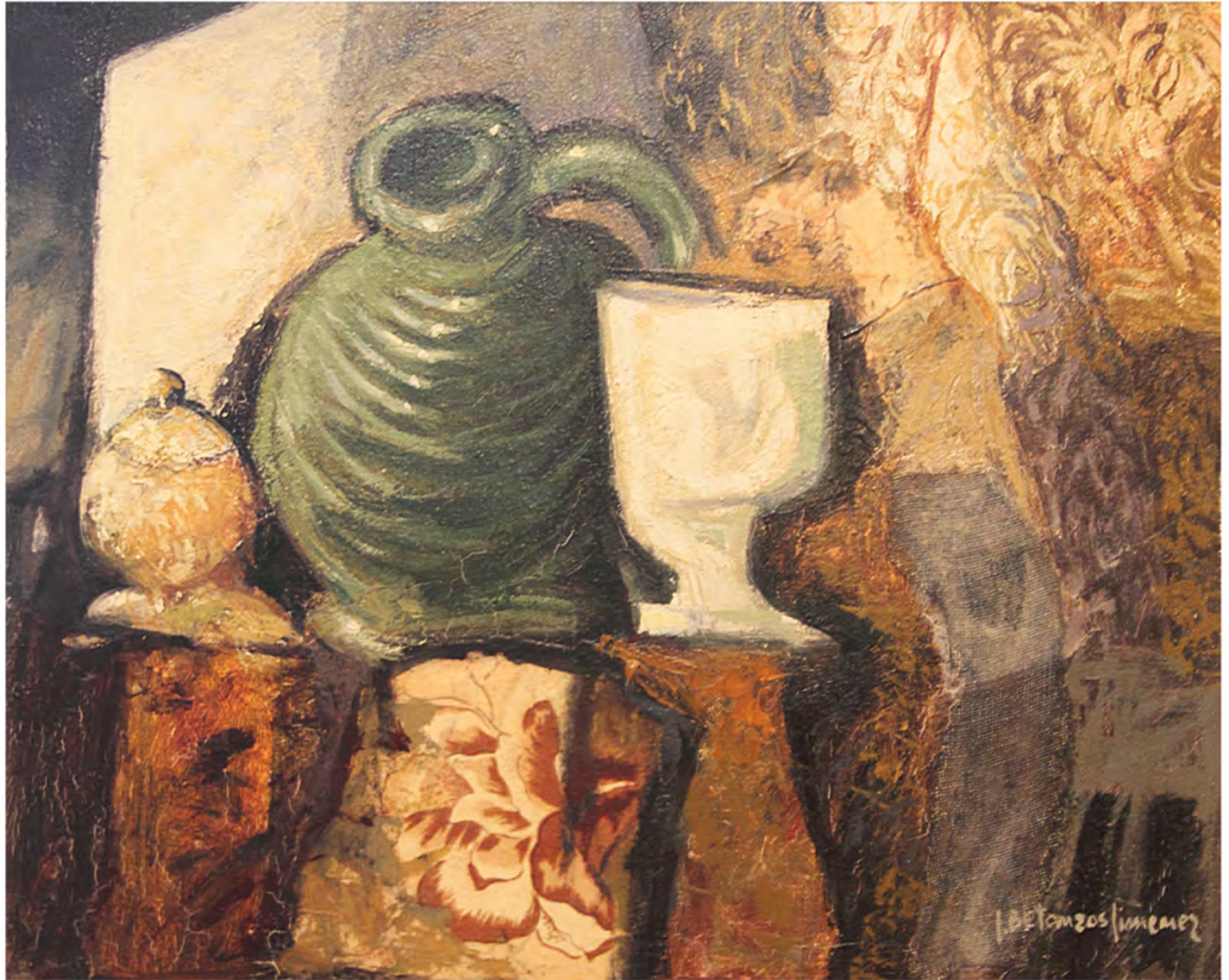
Bodegón de la copa, Oleo 0,69 x 0,60