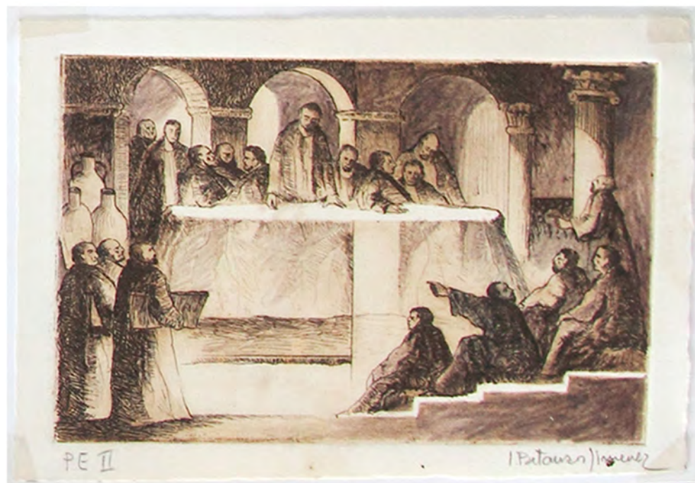
Prueba de estado