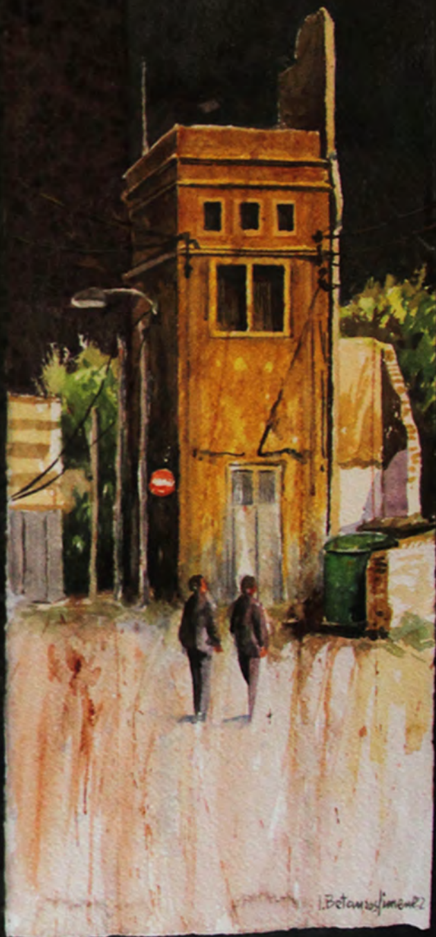
Plaza de toros, Acuarela 0,90 x 0,68