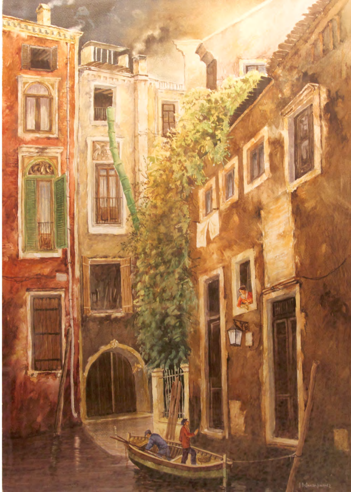
Canal de Venecia, Acuarela 1,20 x 0,98