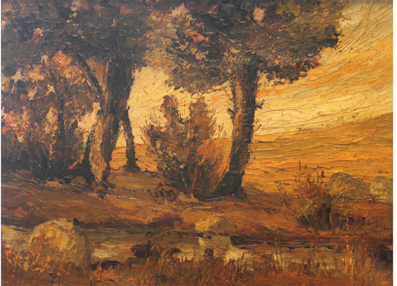
Paisaje de los alrededores de Madrid, Oleo 0,45 x 0,33