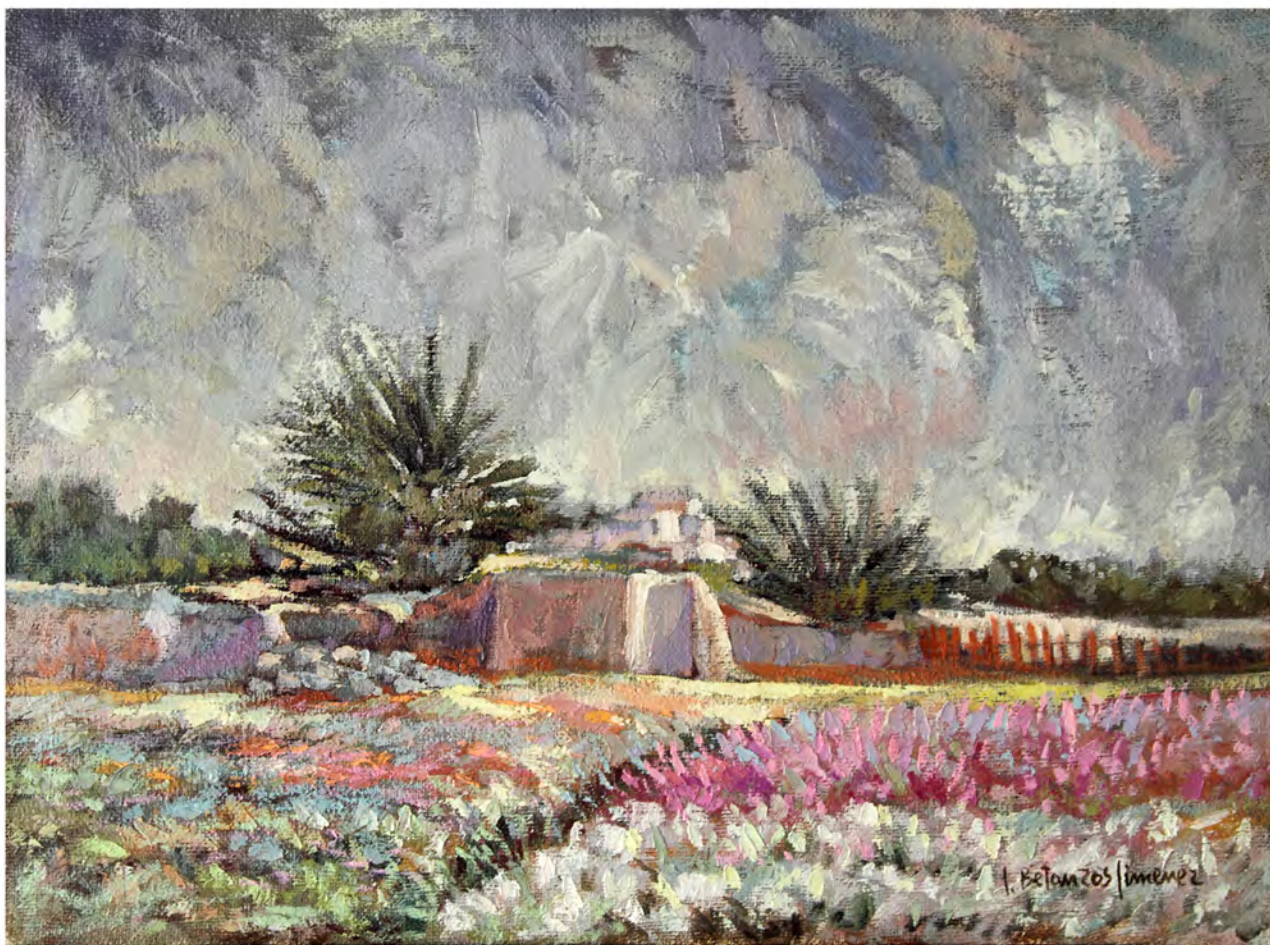
Noria en Los Dolores. Oleo 0,73 x 0,54