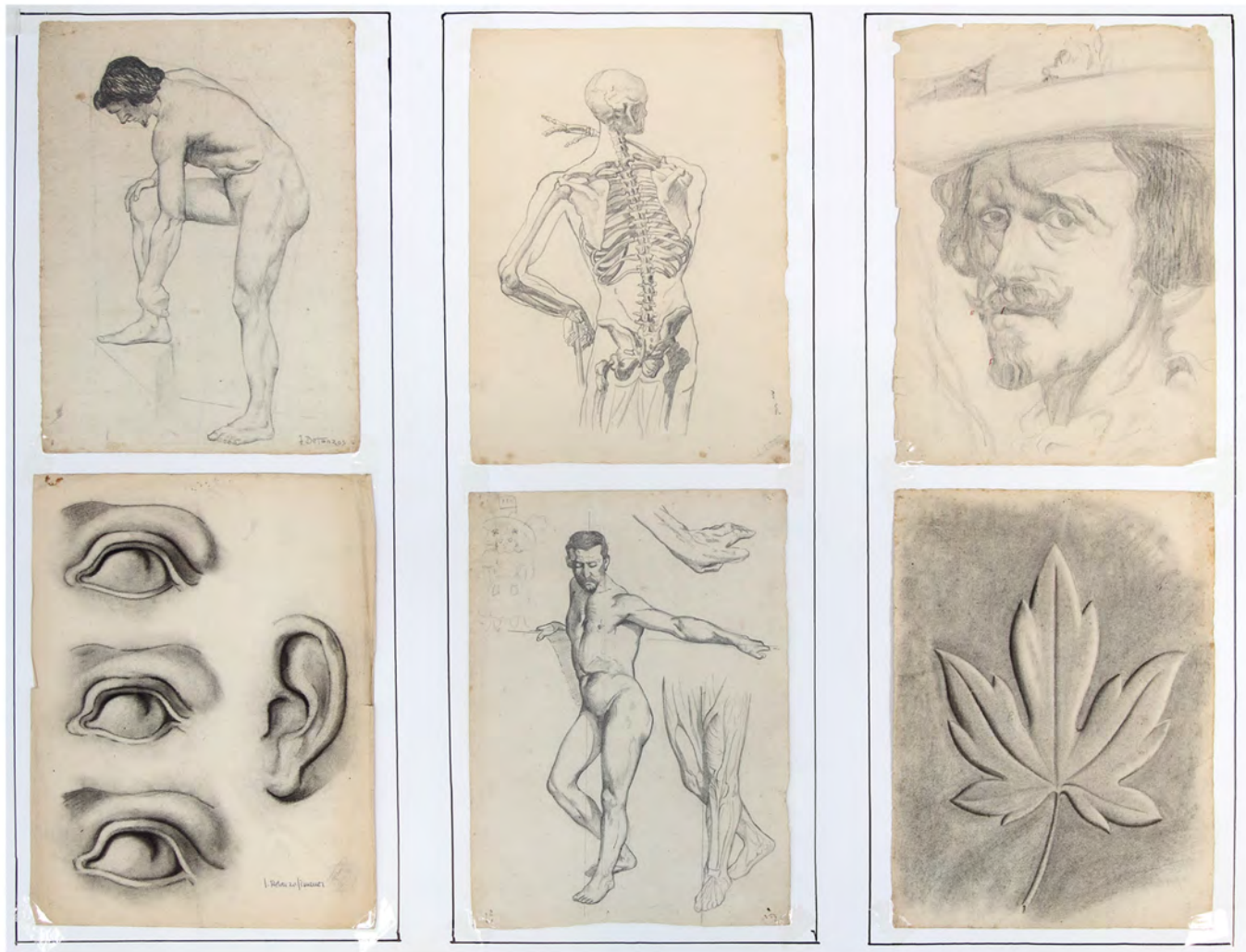
Metacrilato con 6 dibujos del estudio de D. Vicente Ros, 1,00 x 0,68.