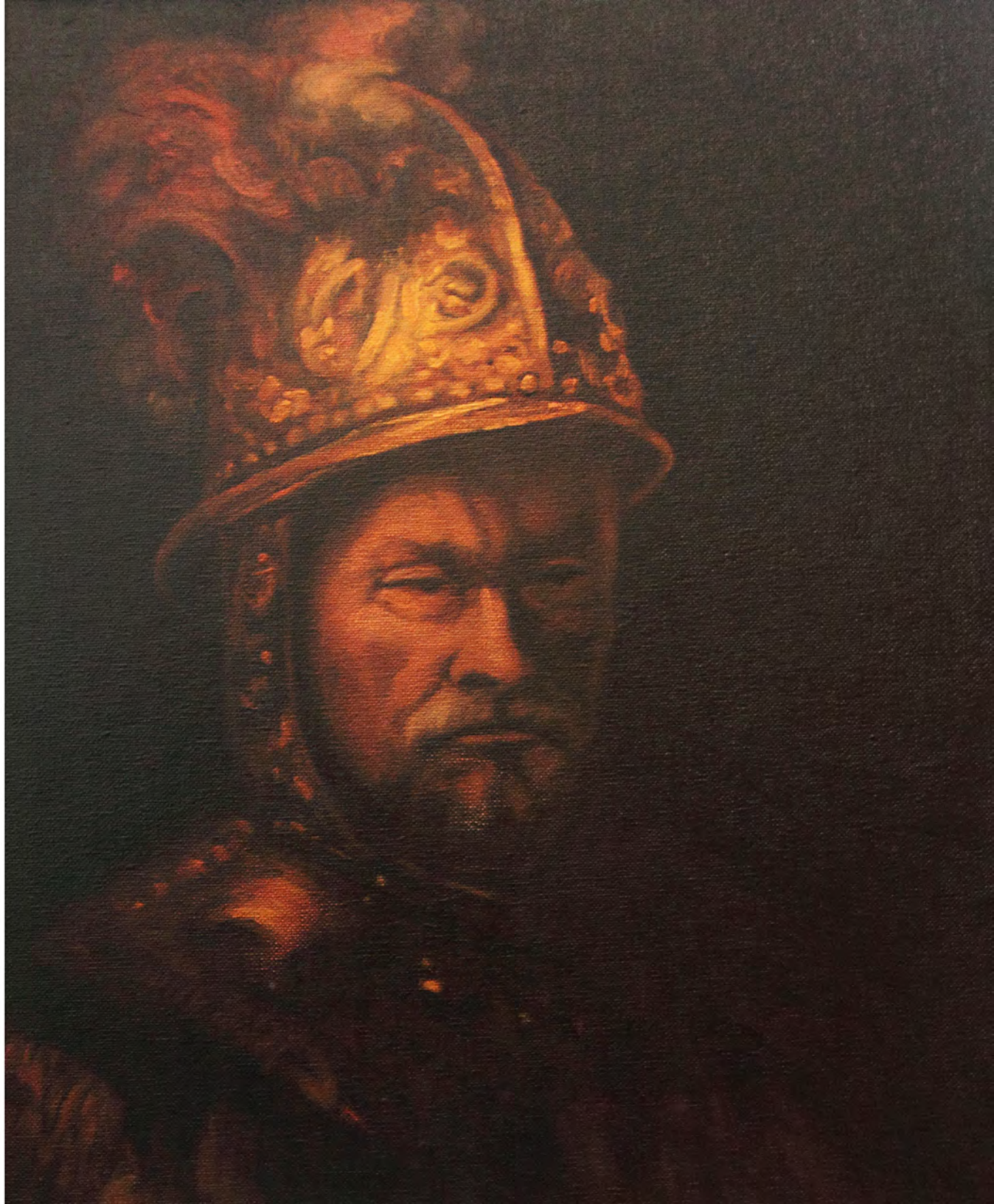
Hombre del Casco de Rembrandt, Oleo 0,41 x 0,33