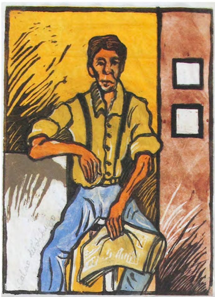
Calco del dibujo