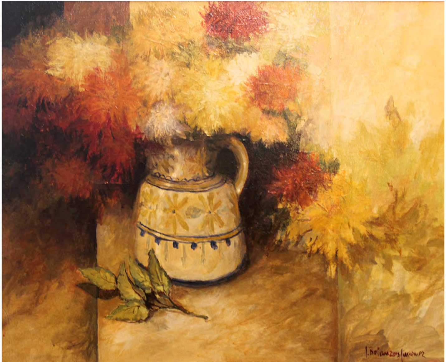
Bodegón de flores, Oleo 0,78 x 0,63