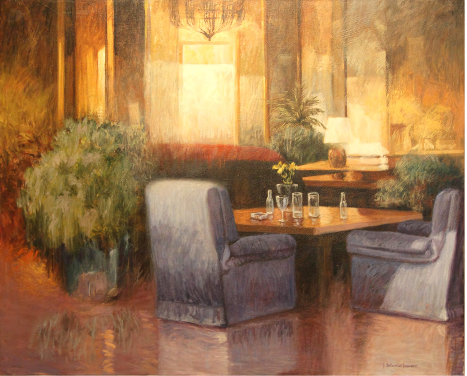
Salón de lectura, Oleo 1,14 x 0,95