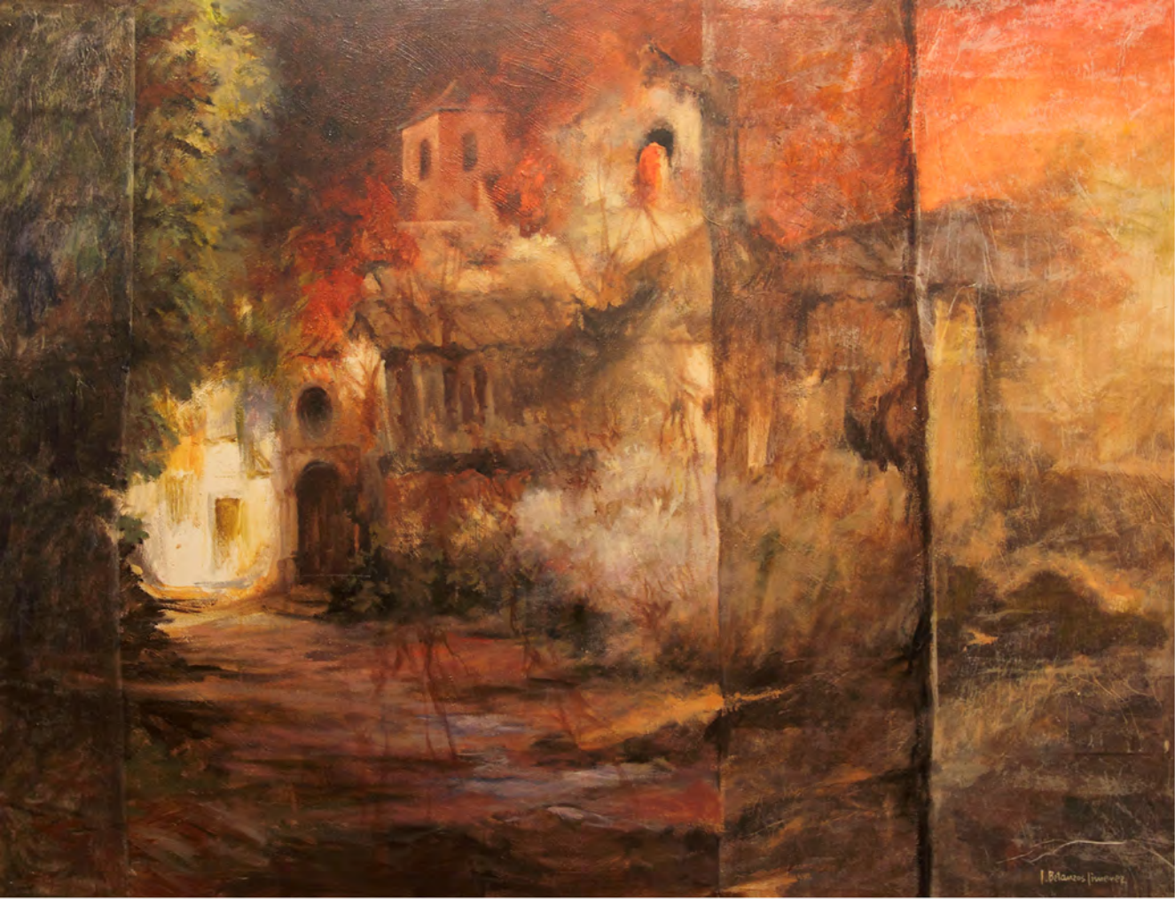
Iglesia románica, Oleo 1,20 x 0,92